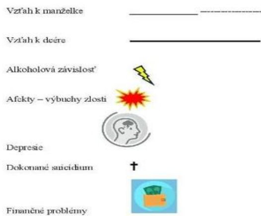
Obrázok 3 Legenda ku genogramu sociálnych vzťahov rodiny a klienta sociálnej práce